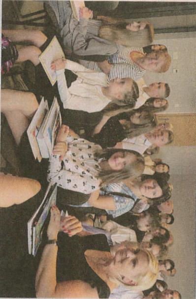
Uroczyste podsumowanie konkursu odbyło się w Strzełińskim Ośrodku Kultury